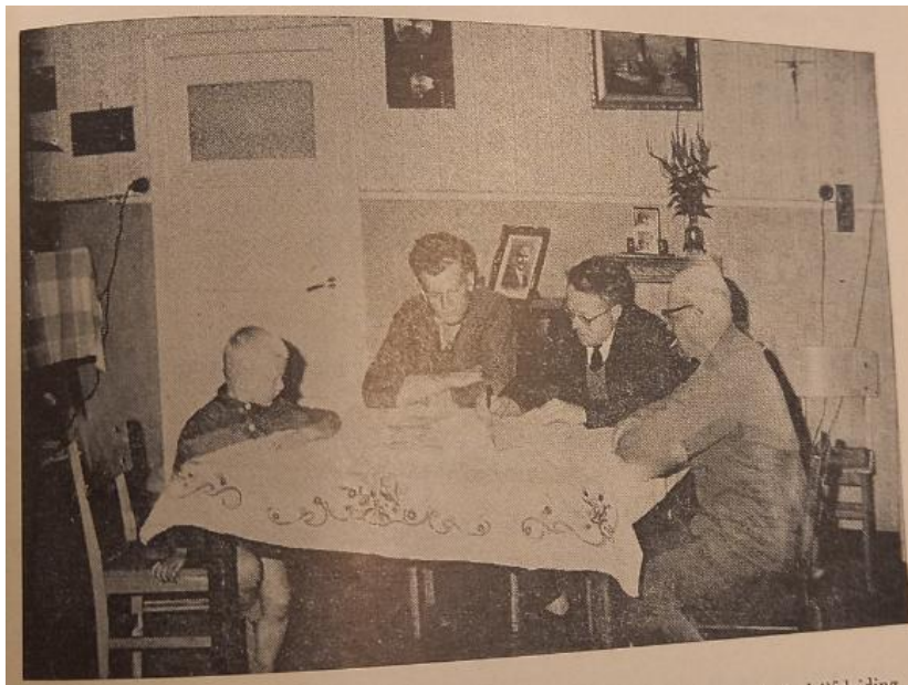
Afbeelding 1: ideaalbeeld van drie generaties die daadwerkelijk belang stellen in de raadgeving van de bedrijfsleiding. 258