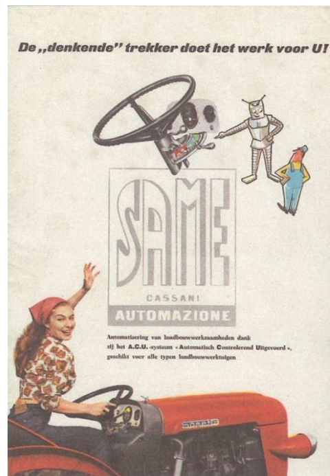
Afbeelding 2: reclamefolder voor de ‘denkende!’ trekker van SAME, ca. 1970. 329

De tractor was hét statussymbool van de moderne en gemotoriseerde landbouwuitbating. Op bovenstaande afbeelding werd een boerin voorgesteld die een tractor aan het besturen is. Toch blijkt dat een vrouw die plaatsnam achter het stuur eerder een uitzondering was dan de regelmaat. 330 Maar waarom werd de boerin in deze reclame toch zo in beeld gebracht?